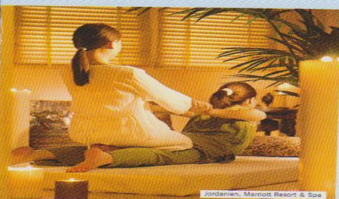
Jordanien, Marnott Resort & Spa