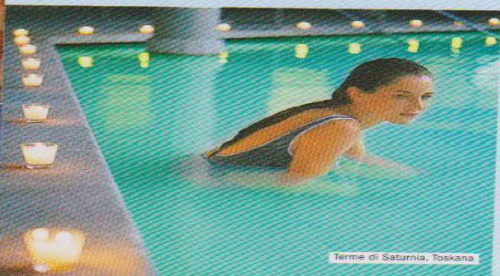
Terme di Saturnia, Toskana