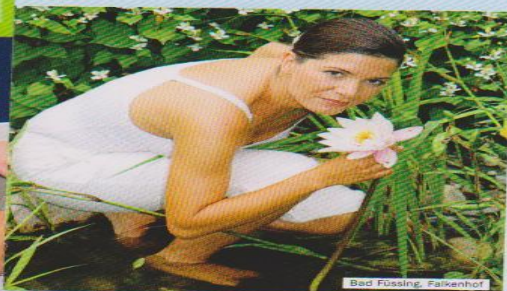
Bad Füssing, Falkenhof